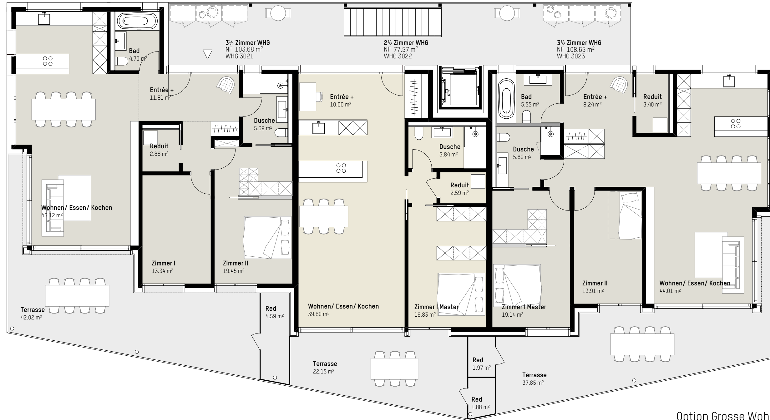
Option Grosse Wohnung